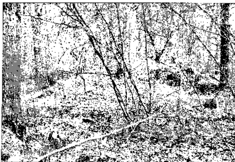
Рис. 1. с. Озеряни, курган на кладовищі