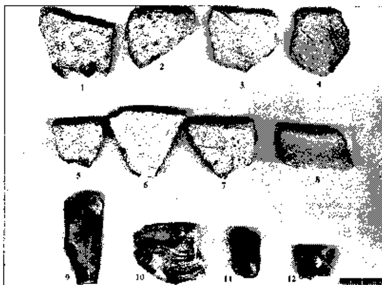
Рис. 2. с. Кішкин, знахідки з пункту 1 а та 1 б