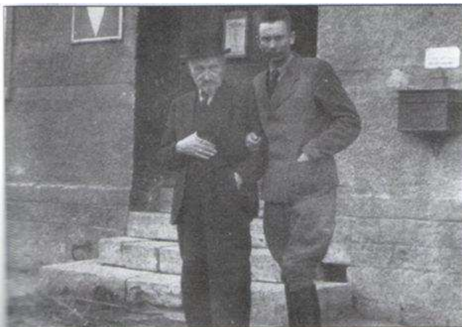
Отаман Тарас Бульба-Боровець з Президентом УНР в екзилі Василем Лівичем. 1947 рік

Олевська республіка, як і планувалось, стала початком відродження держави Українська Народна Республіка, задля відновлення якої, під керівництвом Президента та Уряду УНР в екзилі, завжди діяв Отаман Тарас Бульба-Боровець. Олевська республіка є тією ланкою котра з'єднає Українську Народну Республіку з сучасною Україною, з нагоди відновлення державної незалежності України, Державний Центр Української Народної Республіки в екзилі за віддану й жертвенну підтримку Державного Центру УНР в екзилі в його боротьбі за волю і державну незалежність України, нагородив Генерала Хорунжого Тараса Бульбу-Боровця Грамотою. 22 серпня 1992 року у Києві Вірчі Грамоти, гетьманські клейноди, печатка та прапор УНР було передано як правонаступниці незалежній державі Україна.