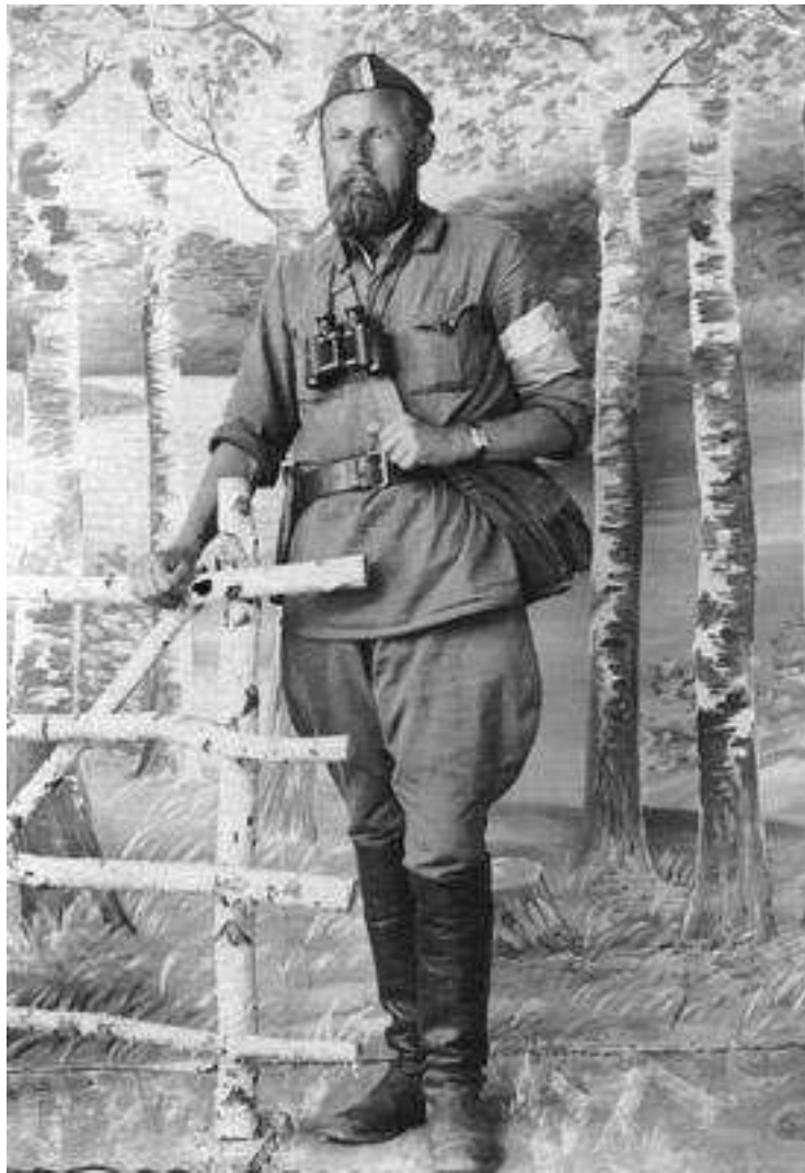
Тарас Бульба-Боровець ( 2 вересня 1941 р.)

21 серпня 1941 року у ході Олевської наступальної операції проти червоних окупантів підрозділи Поліської Січі під командуванням поручника Омелянова в кількості не менше 300 чоловік остаточно заволоділи Олевськом і поширили свій контроль на територію Олевського, частини Овручського, Ємільчинського, Лугинського районів Житомирської області. Німецький окупант на цю територію ще й не потикався, а залишки більшовицького окупанта були розгромлені наголову. Олевськ став столицею вільної української республіки, яка увійшла в історію під назвою Олевська республіка, територія та населення якої були більші за такі держави, як Бельгія, Нідерланди. Республіка мала власне військове формування УПА «Поліська Січ» штаб якого містився в одноповерховому будинку зведеному 1905 року, в штабі зберігалися національні цінності – Прапори УПА «Поліська Січ», Олевської республіки, прапор подарований Президентом УНР в екзипі А.Лівицьким, ікона Божої матері подарована Митрополитом