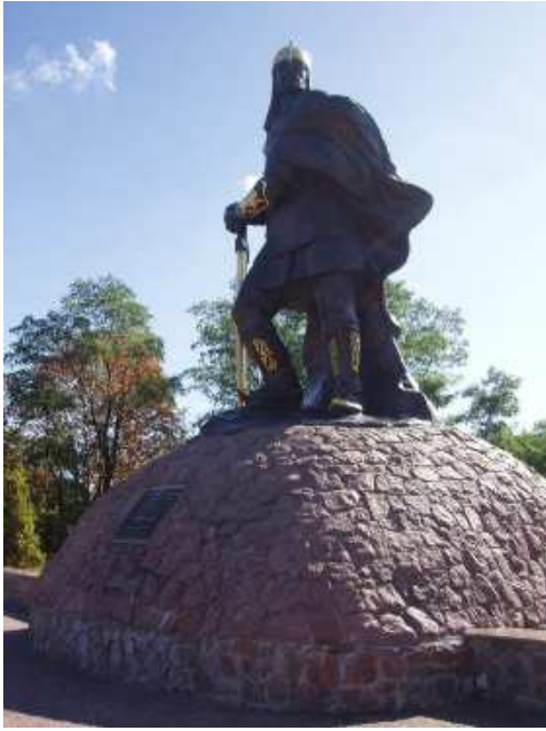
Пам'ятник князю Малу у Коростені.